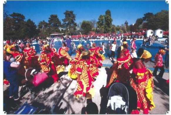
民族衣装に身を包み 会場内をパレード