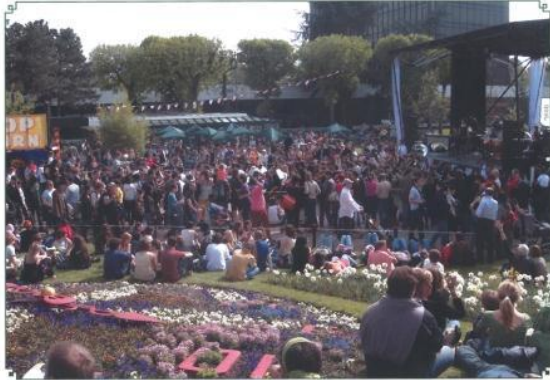
屋外ステージ実施状況

会場に設営された屋外ステージまたは常設劇場舞台において、音楽やダンス、伝統芸能等パフォーマンスを行っていただくことができます。