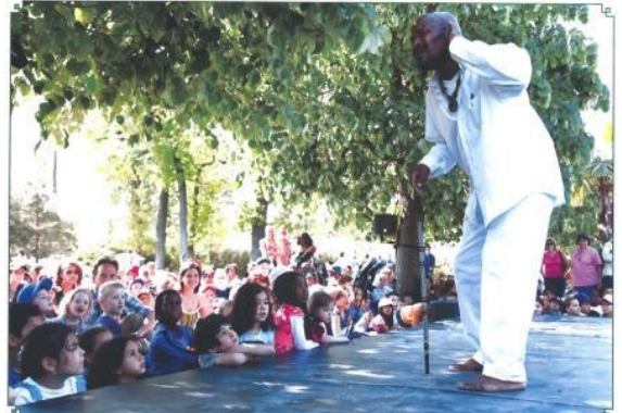
ステージに魅了される子供たち