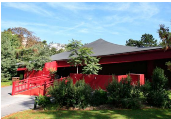
公園内常設劇場(300人収容)