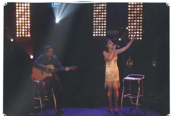
劇場内ステージにおける公演