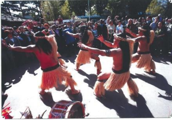
オープンスペースを利用し 伝統的な踊りを披露

公園内の遊歩道や芝生などのオープンスペースを利用し、阿波踊りやねぶた祭りといったダイナミックな踊りを伴う行列や祭り神輿、武者行列や手筒花火といった、日本の地域色あふれる元気なアトラクションを行っていただくことができます。