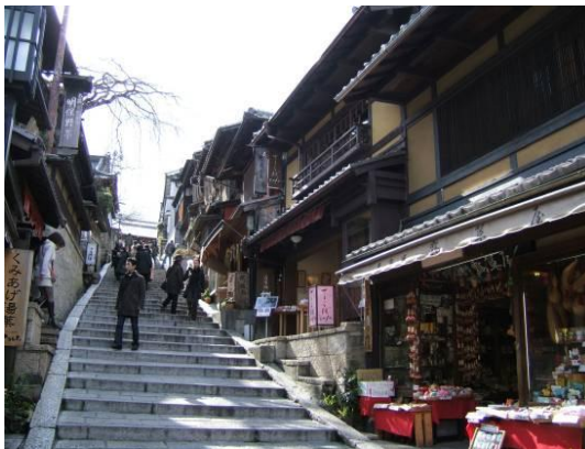
今回のイベントにおいては、現代風 「楽市・楽座」をイメージしたブー スを検討中