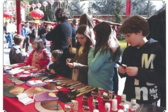
ブース内で販売される 地域の伝統工芸品