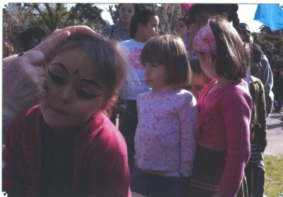
インドの伝統的なフェイスペイント に挑戦する子供たち

公園内にあるアトリエ館を利用し、子供たちを中心とした来場者を対象にした様々な体験コーナーを設置し、武道や書道、料理教室や着物の着付けをはじめ、その場で気軽に体験できる折り紙やあやとりなど、日本の伝統的な文化や遊びを体験していただくことができます。