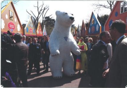
園内遊歩道の両側を埋めるブース