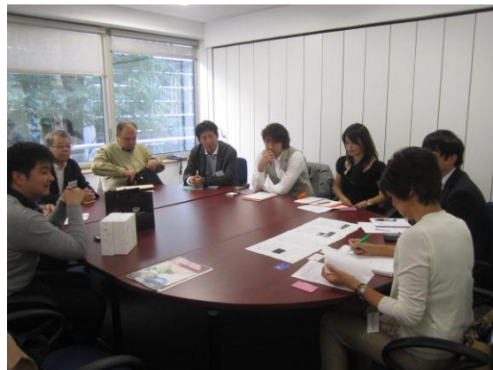
販路開拓についてレクチャーを受ける訪問団の皆さん～ジェトロパリにて～

市場調査として、デパート、ブランドショップ、セレクトショップ及びニット衣料品店等を訪問し、日本との品揃えや価格比較、展示方法の違い等の調査を行いました。