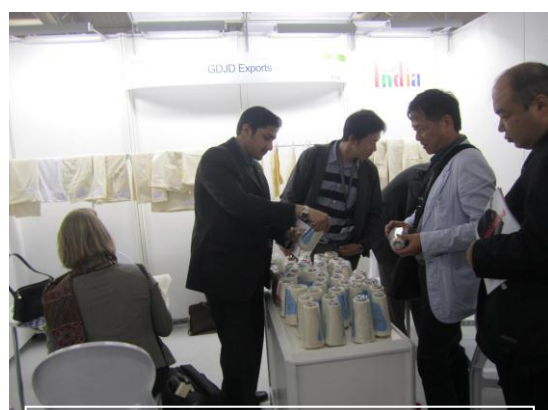
～テックスワールド会場内～ 糸や生地を見る目は真剣そのもの！