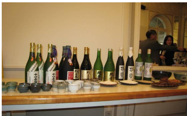
会場で提供された栃木県の地酒と益子焼のぐいのみ

観光プレゼンテーションが終わった後、昼食会が行われ、栃木県の特産品が参加者に提供されました。特に栃木県の地酒のおいしさをフランス人に味わってもらうために、日本から持参した県特産品の益子焼のぐいのみを用いただけでなく、栃木県にお店を持つフレンチレストランのシェフの助言をもとに、地酒に合う料理が提供されました。その料理には、現地の新鮮な食材を使用しており、ヴォークューズ県への細やかな気遣いも感じられました。