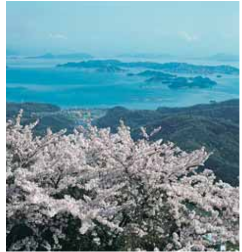
La mer Intérieure depuis le Kinkô.zan

La construction du Kôroku.en, qui demanda 14 ans de travaux, fut entreprise il y a plus de 300 ans à l'initiative du daimyô du fief d'Okayama, IKEDA Tsunamasa. Un certain nombre de fêtes rituelles destinées à marquer telle ou telle saison - comme la « cueillette du thé » ( chatsumi ) ou la « moisson du riz » ( inekari ) - y sont célébrées aujourd'hui encore.