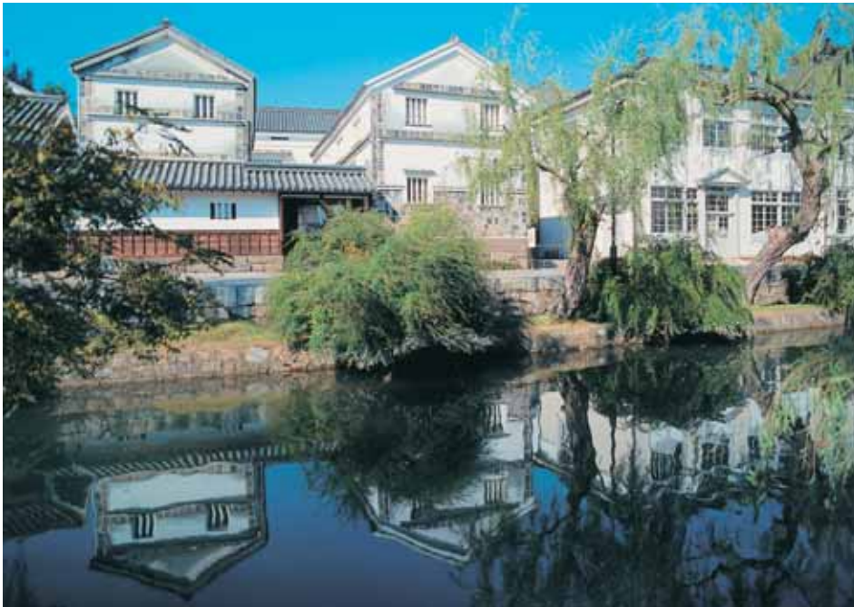
Quartier traditionnel de Kurashiki Bikan

Le département est favorisé par la beauté de ses lieux touristiques, empreints des charmes du Japon ancien : on citera notamment le Kôroku.en, l'un des trois plus beaux jardins traditionnels du Japon, situé dans la ville d'Okayama, ainsi que le « secteur de site remarquable » de Kurashiki, une ville chargée d'Histoire, qui a conservé son cachet.