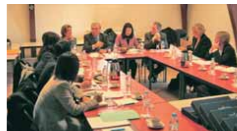
Réunion de travail au conseil général du Rhône

Une personne de l'Association de Tourisme Rural nous expliqué qu'il était possible de promouvoir une région en proposant aux touristes toutes sortes d'activités particulières à cette région. Nous avons pu constater que de telles initiatives contribuent vraiment à redynamiser les régions, ce qui nous a donné l'occasion de prendre conscience une fois de plus de l'importance