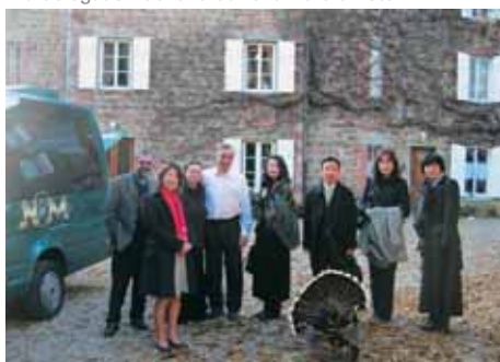
La délégation devant leur chambre d'hôte

résidant pendant plusieurs jours dans un endroit, à y apprécier la vie au quotidien à travers des expériences, et des contacts avec les habitants de la région. Contrairement à ce qui se passe en France, il est encore difficile à l'heure actuelle, pour les Japonais, de prendre de longues vacances, mais ces derniers temps, l'on constate un important essor du tourisme vert et de l'écotourisme. Et des mesures sont prises pour inciter les citoyens à aller faire l'expérience de la vie à la campagne.