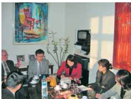
Accueil à la mairie du Mans

CLAIR organise chaque année à l'étranger des séjours permettant à de jeunes fonctionnaires de l'administration locale japonaise d'étudier les systèmes administratifs et financiers de différents pays. En 2005 ce séjour, qui a duré trois mois et demi, a eu lieu à partir de septembre en Angleterre et en France.