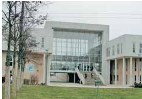
La faculté de Lettres d'Orléans

dans sa section, déplore les conditions d'apprentissage rendues plus difficiles par le trop grand nombre d'étudiants en première année. Si le cours de culture japonaise est donné sous forme magistrale, fort heureusement les cours de langue (grammaire et oral) sont divisés en deux classes. Cela fait tout de même un effectif de 40 étudiants par classe. Il faudra donc envisager de diviser à nouveau les classes si cette tendance se confirme.