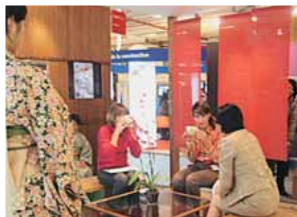
Salon des Maires et des Collectivités Locales

Notre stand, conçu dans le style japonais, a attiré comme chaque année l'attention des visiteurs qui n'hésitaient pas à s'arrêter un moment pour discuter. Pour ceux d'entre eux qui souhaitaient approfondir la conversation, nous avions prévu un coin salon de thé. Les visiteurs pouvaient expérimenter la cérémonie de thé, tout en profitant d'informations. Nous avons fait appel à des maîtres de thé qui officient en France. Enfin, petite touche moderne très appréciée des visiteurs, deux écrans plats projetaient des images du Japon.