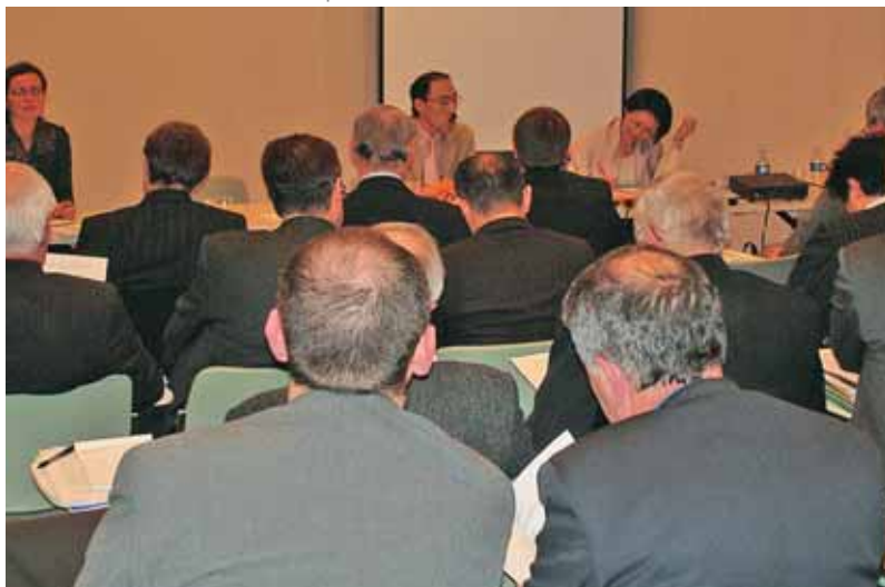
Conférence à l'Assemblée des Départements de France